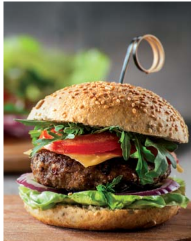
Mini Angus Burger